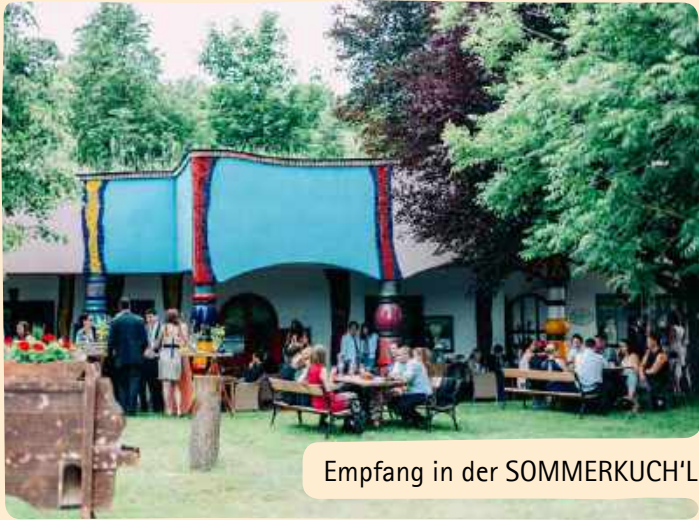
Empfang in der SOMMERKUCH'L