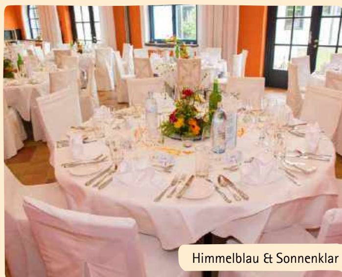
Himmelblau & Sonnenklar