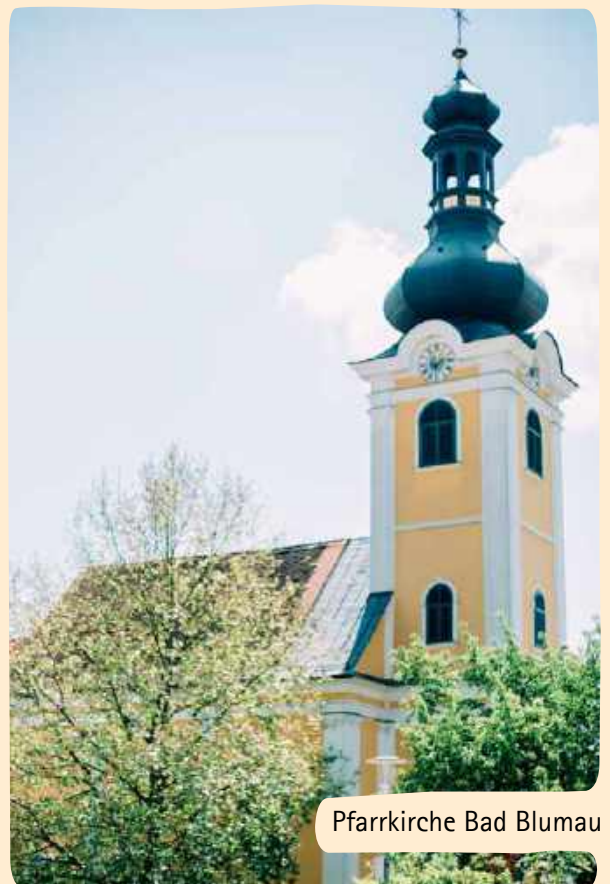
Pfarrkirche Bad Blumau